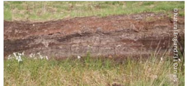
Mil o flynyddoedd o fawn

Mae bwyell o'r Oes Efydd, a ddarganfuwyd yn y mawn mewn haen o fonion pinwydden yr Alban a oedd yn 3,400 o flynyddoedd oed, a darganfod tri chorff dynol o'r Oes Efydd a'r cyfnod Brythonaidd-Rufeinig, yn dweud wrthym fod pobl wedi byw a gweithio yma am gyfnod hir iawn.