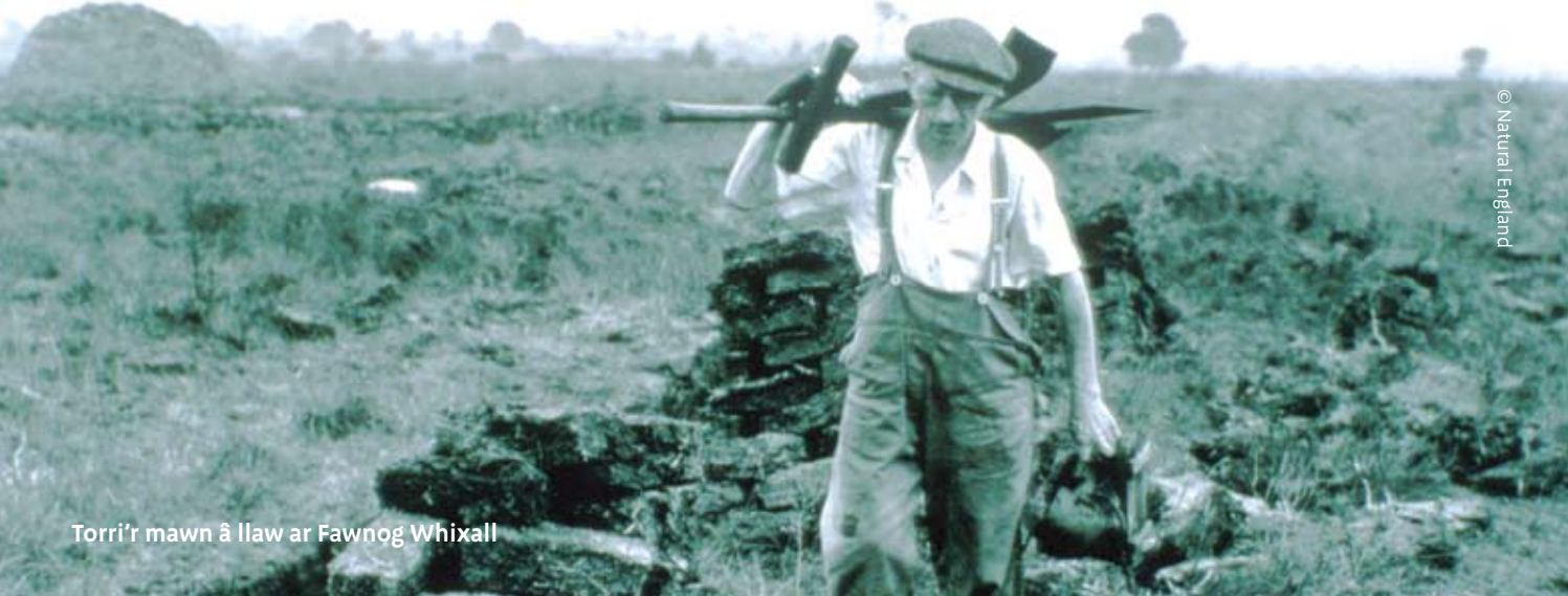
Torri'r mawn â llaw ar Fawnog Whixall