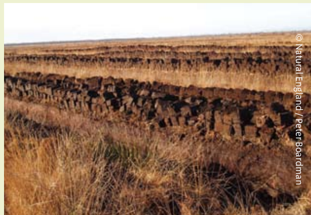
Torri mawn yn difetha'r gorffennol

Fe ddechreuwyd torri mawn yn fasnachol gyda pheiriannau yn 1968, ond pan gynyddodd y torri mawn bedair gwaith yn 1989, fe lanswyd ymgyrch i achub y Mawnogydd. Fe ddaeth y rhan ganol yn Warchodfa Natur Genedlaethol, ac yn 1990, fe ddaeth torri mawn ar raddfa fawr i ben.